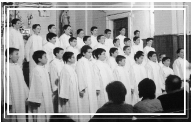
Concierto en la iglesia de S. Pedro "ad vincula" de Vallecas. Navidad de 2003.