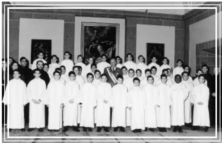
La Escolanía posa con S M el Rey en la sala de la Trinidad. 4 de marzo de 2003.