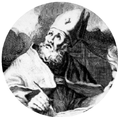
Bianchi. S. Agustín . (grabado s. XVIII)

El cantar es propio del que sabe amar S. Agustín (Serm. 336, 1, 1)