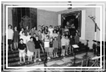
Grabación en el Aula Magna. Agosto de 2002.