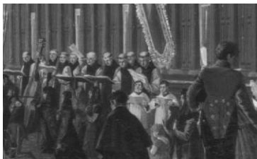
Niños cantores con la Capilla de Música Detalle de un cuadro de Bambrilla

Las obras seleccionadas para esta grabación ofrecen una variada muestra de las conservadas en el Archivo de Música del Monasterio, compuestas por monjes escorialenses cuya formación musical, en la mayor parte de los casos, se desarrolló en esta casa. Comenzando en la Hospedería (siendo niños cantores de la Capilla de Música) o en el Seminario (como uno de los 40 alumnos de Latín, Gramática y Canto). Esta selección puede servir para dar una visión de conjunto del Archivo y ofrecer un ejemplo de una de las artes que tanta majestuosidad añadió a la de sus compañeras: la Arquitectura, Escultura y Pintura en esta "Octava Maravilla", según nos relatan sus cronistas e historiadores.