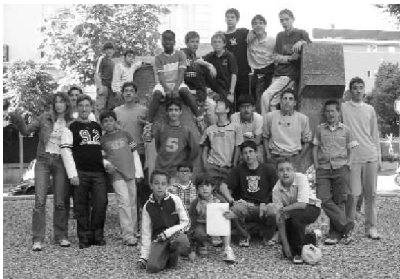
En la fachada de la Fundación Juan March de Madrid. Mayo de 2005

Textos/ texts : Gustavo Sánchez, y J. Rolando García. OSA