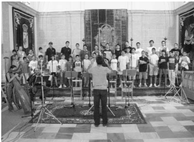
Aula Magna. Agosto de 2005