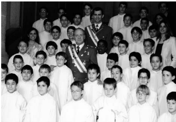
S. M. el Rey D. Juan Carlos y S.A.R. el Príncipe posan con los niños de la Escolanía. Junio de 2005