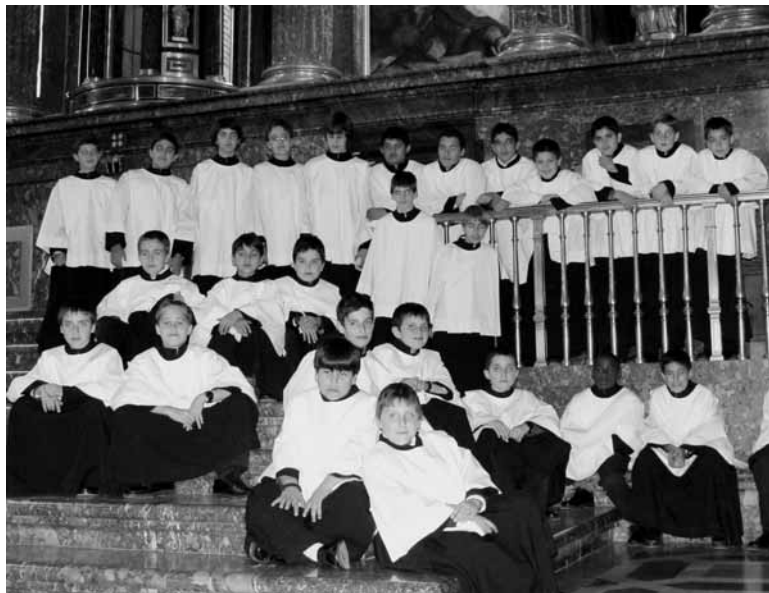
En el presbiterio de la Basílica. Diciembre 2007