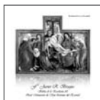
Stabat Mater Vivaldi